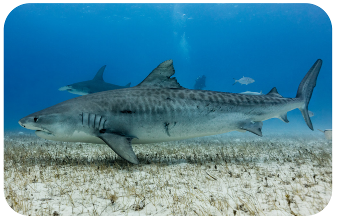
Le requin tigre des sables, avec ses dents puissantes et pointues, mangera tout ce qu'il peut avaler, y compris des restes de nourriture, des plaques d'immatriculation de voiture ou des pots de peinture. On le surnomme le requin poubelle.

Ce que les requins chassent pour se nourrir dépend de l'endroit où ils vivent et de la manière dont ils vivent. Certains aspirent de minuscules animaux et plantes flottants avec leur énorme bouche. Certains sont des nageurs rapides qui attrapent le poisson avec leurs dents effilées et pointues. D'autres cherchent, le long des côtes, des phoques, des dauphins et des oiseaux de mer. Beaucoup vivent dans les profondeurs où ils se nourrissent de crabes et de coquillages de l'océan. Tous les requins mangent d'autres animaux.