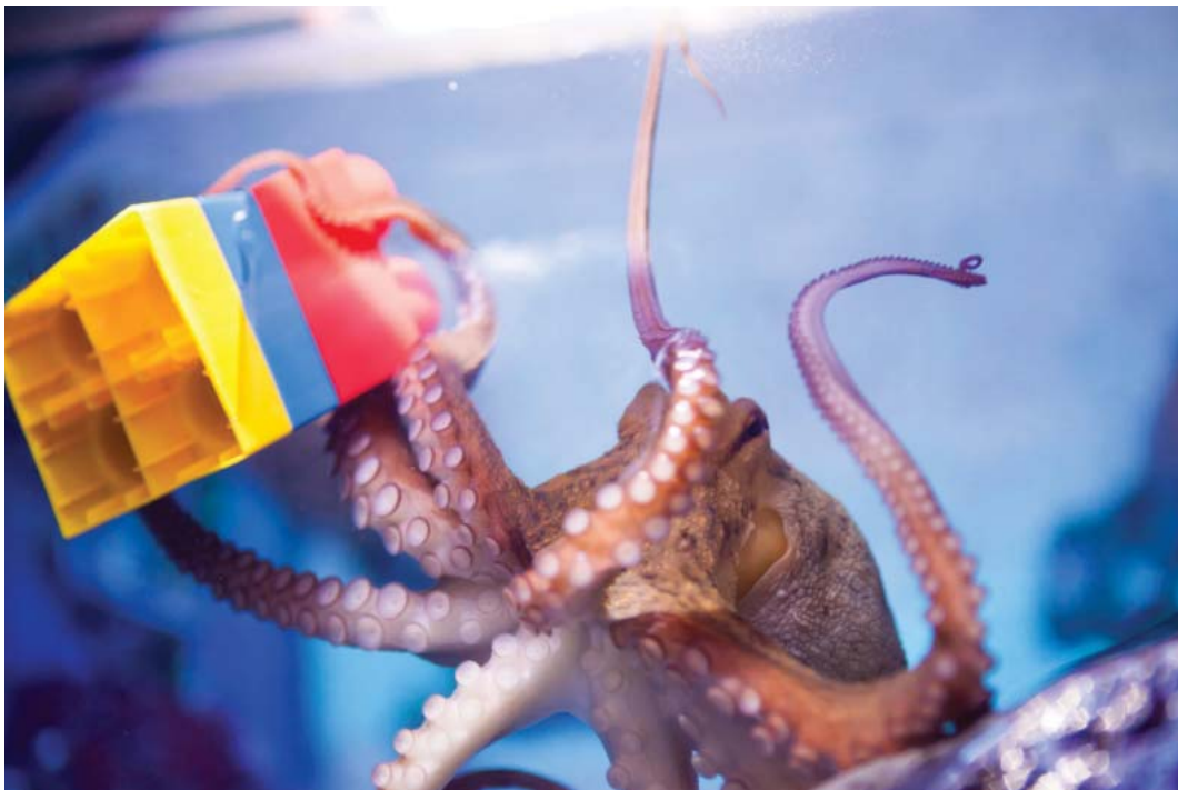
Une pieuvre en train de s'amuser avec un jouet dans son bassin.

Dans un aquarium aux États-Unis, une pieuvre qui s'appelait Sammy aimait jouer avec une balle en plastique dont les deux moitiés se vissaient ensemble. Son gardien mettait de la nourriture à l'intérieur de la balle, et Sammy ouvrait la balle en dévissant ses deux moitiés, puis les vissait ensemble à nouveau quand il avait fini de manger.