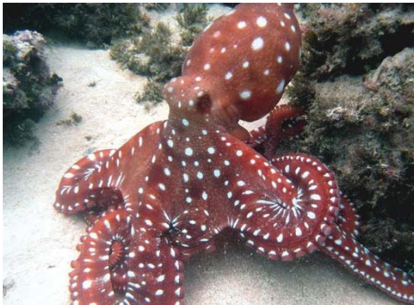
Une pieuvre fait fuir ses prédateurs grâce à ses taches.