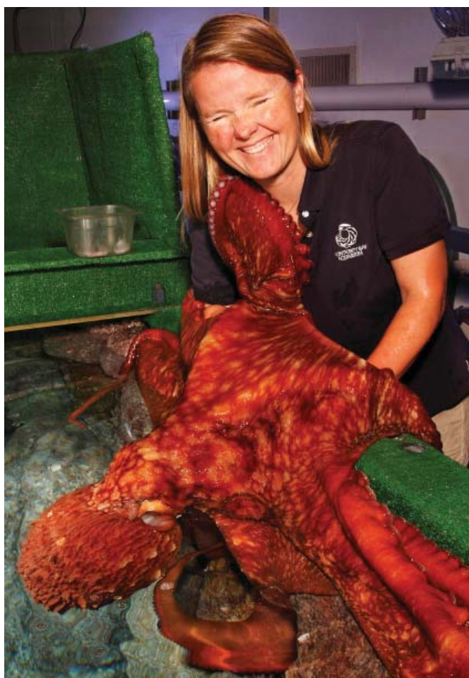
Une pieuvre accrochée aux bras de sa gardienne

Les pieuvres apprécient la compagnie autant que la nourriture. Lorsque les pieuvres ont fini de manger, elles dressent un bras, puis un autre, en les courbant au-dessus des mains et des bras de leur gardien. La pieuvre et son gardien se tiennent par les bras, et la pieuvre s'accroche délicatement à son gardien avec ses ventouses.