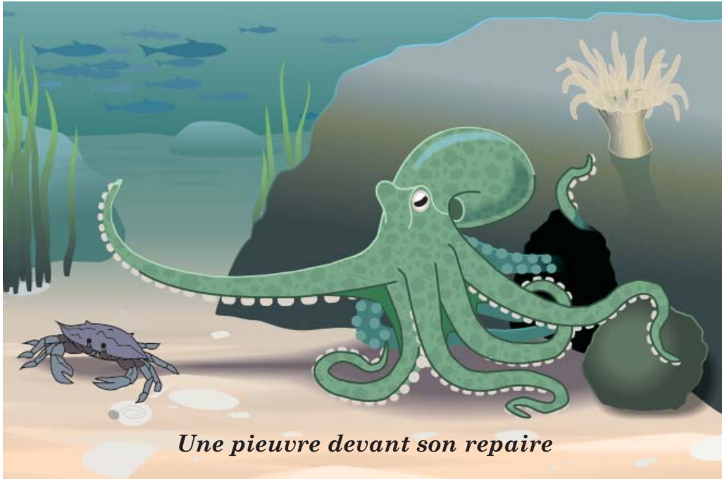
Une pieuvre devant son repaire

Les pieuvres sont des animaux marins qui ont le corps arrondi, des yeux exorbités et huit longs bras. Leurs bras sont très forts et recouverts de ventouses puissantes. Elles vivent dans tous les océans du monde, mais elles aiment particulièrement les eaux chaudes et tropicales. Elles restent souvent au fond de l'océan où elles peuvent trouver leurs aliments préférés. Elles aiment manger des crabes, des crevettes et des petits poissons. Elles attrapent leur proie grâce à leurs ventouses et portent ensuite la nourriture à leur bouche.