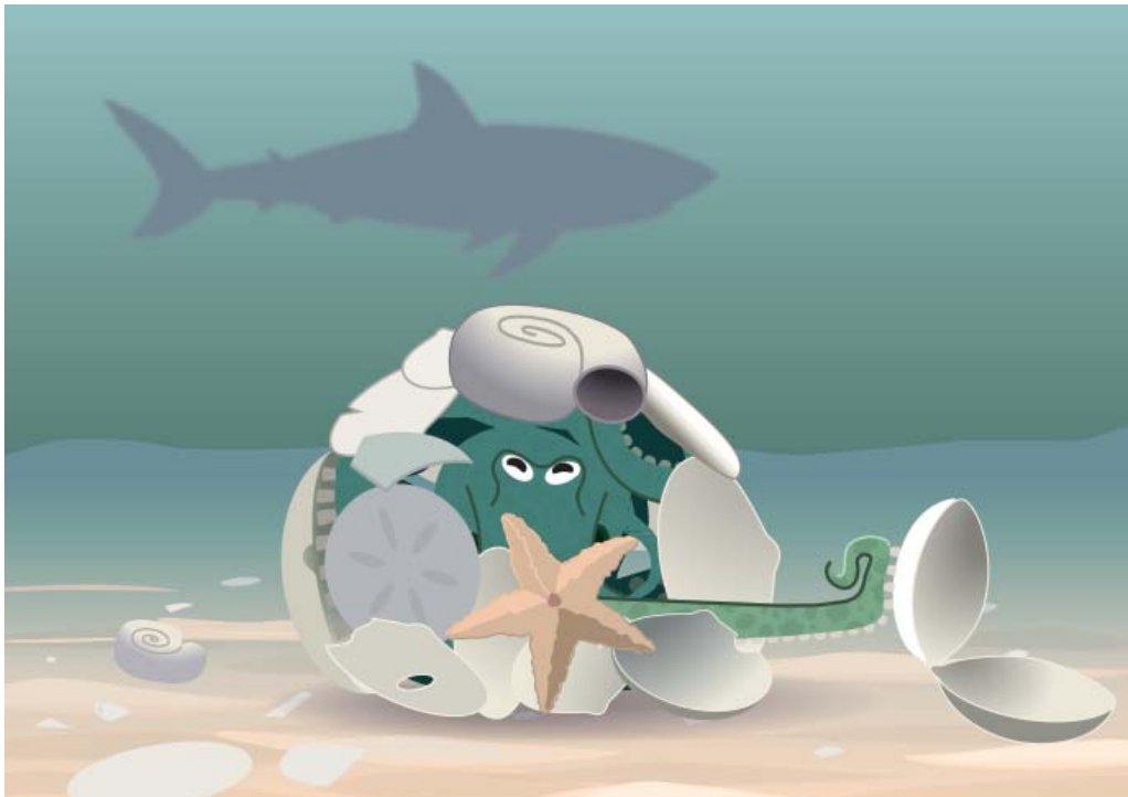
Une pieuvre cachée sous des coquillages.

Parfois, les pieuvres utilisent même des coquillages pour se cacher. Elles les ramassent avec leurs ventouses. Ensuite, elles enroulent leurs bras autour de leur corps, de manière à ce que ces coquillages soient dirigés vers l'extérieur. Les prédateurs qui passent par-là pensent alors que la pieuvre n'est qu'un vieux tas de coquillages.